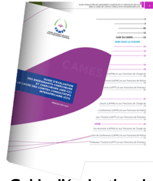
Guide d'évaluation des enseignants-chercheurs dans le cadre des CCI